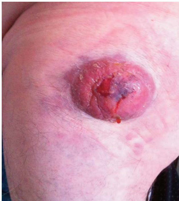
Figura 1. Masa en región glútea de 6 cm y centro ulcerado.